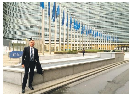
Wizyty w Brukseli poświęcone są problemom krajowym i regionalnym