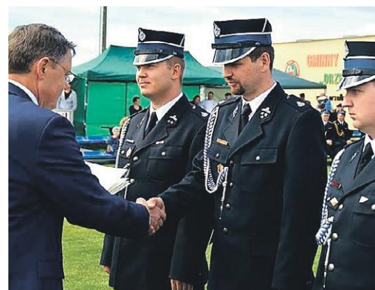
Od początku pracy parlamentarnej, poseł zaangażowany jest w działalność Ochotniczych Straży Pożarnych