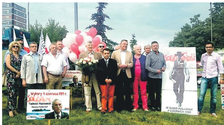
Co roku dla upamiętnienia wyborów 4 czerwca organizowany jest happening na rondzie im. Tadeusza Mazowieckiego – pierwszego niekomunistycznego premiera III RP