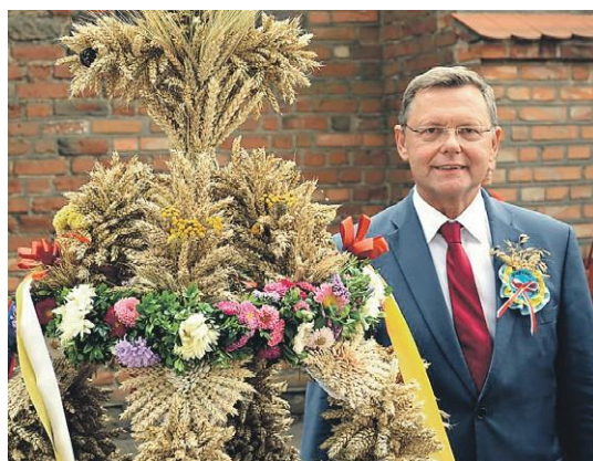
Dożynki, w których poseł corocznie uczestniczy, są doskonałą okazją do podziękowań rolnikom za trud i wysiłek wkładany w pracę na roli