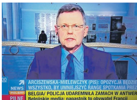
Posel Tomasz Nowak jest również komentatorem wydarzeń sejmowych w mediach ogólnopolskich i regionalnych