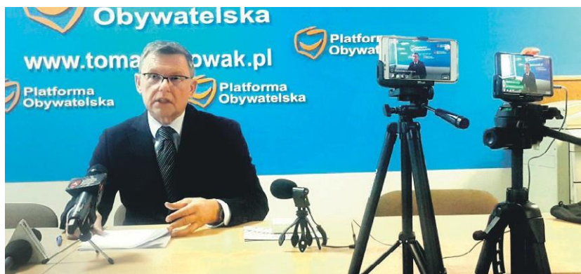
Regularne w regionie konferencje prasowe oraz aktywnosc w mediach społecznościowych