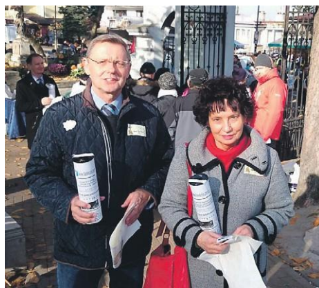
Posel jest wolontariuszem corocznej kwesty na cmentarzu przy ulicy Kolskiej w Koninie, z której środki przeznaczone są na odrestaurowanie nagrobków na konińskiej nekropolii