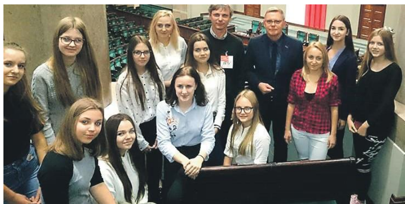
Posel organizuje i przyjmuje wycieczki szkolne z regionu konińskiego oprowadzając po Sejmie i opowiadając o pracy parlamentarnej