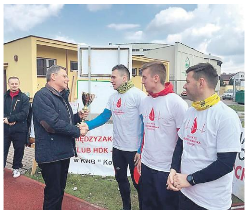
Posel czynnie wspiera Honorowych Dawców Krwi oraz inne kluby i organizacje społeczne