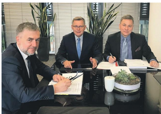
Poseł Tomasz Nowak działa wspólnie z prezydentem Piotrem Korytkowskim i marszałkiem Markiem Woźniakiem

i Golina) rozbudowano sieć kanalizacyjną. Poseł zabiegał także o środki (22 mln zł) na przebudowę CKiS-DK „Oskard”. Ta inwestycja jest dla niego szczególnie ważna, gdyż w latach 1986-1991 był kierownikiem tej instytucji. Poseł konsultował również z samorządami projekt fotowoltaiczny w gminach powiatu konińskiego. Dobrze przygotowane wnioski przyniosły gminom sukces na kwotę dofinansowania ponad 10 mln zł. Realizowany jest w tej kadencji projekt (za 38 mln zł) skrzyżowania ulicy Kolskiej