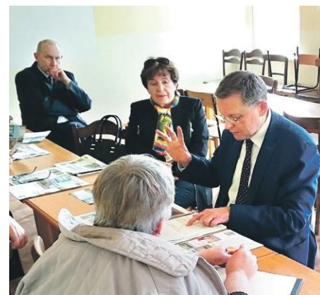
Posel odbywa dyżury i spotyka się z mieszkańcami w każdym powiecie okręgu