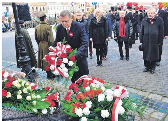
Uroczystości patriotyczne są okazją do wspomnienia historycznych dat i bohaterów walczących o wolność Polski