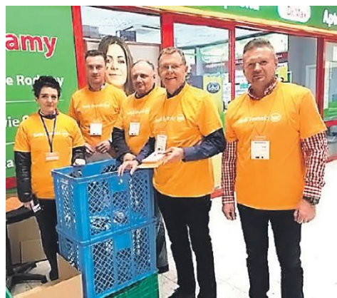
Posel uczestniczy w wydarzeniach charytatywnych